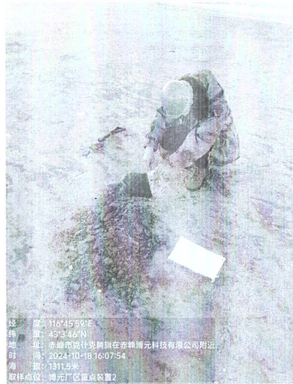
厂区内重点装置区 2#