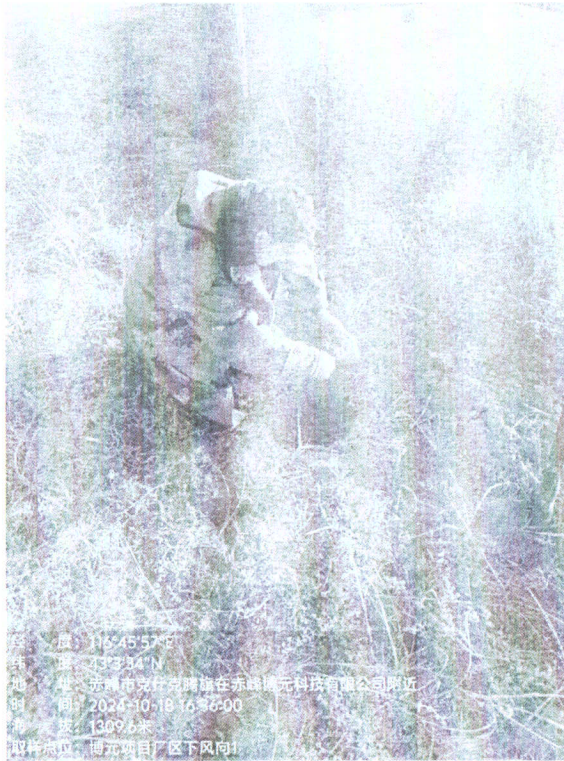
项目厂区外下风向 1#