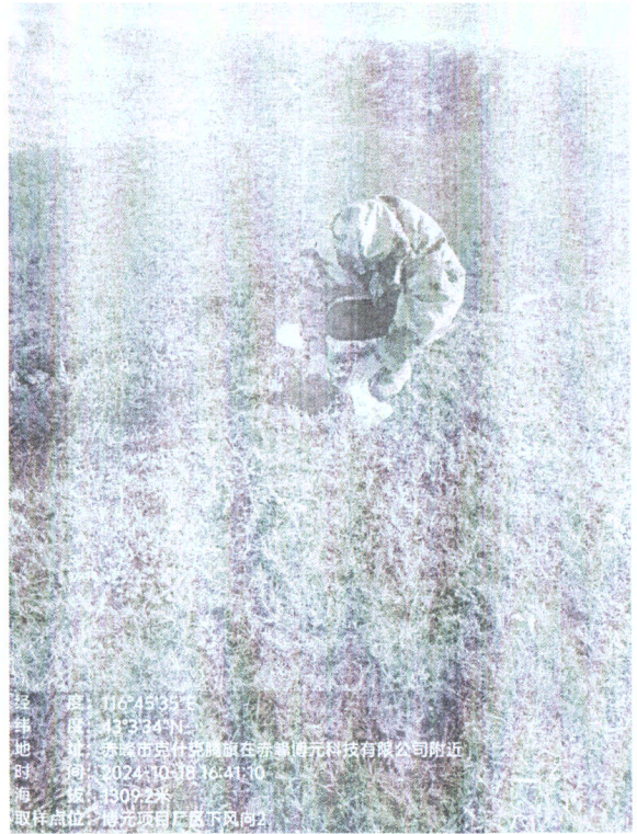
项目厂区外下风向 2#