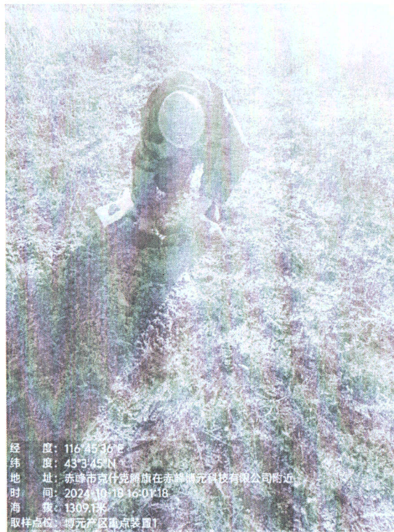
厂区内重点装置区 1#